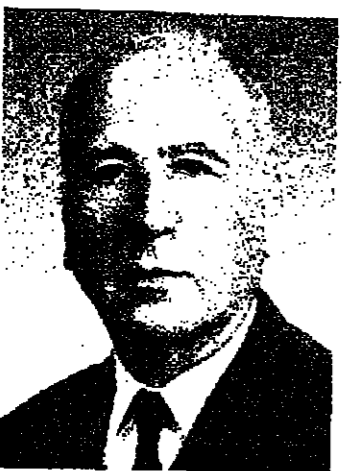
بفلم : الدكتور والتر ايتان

وعندما سيجتمع الاقطاب الأوروبيين في البندقية في الاسبوع القادم ، فقد يملكون نفس الشبه بالنسبة للشرق الاوسط - وقد يقدمون دليلا اخر على قدر نظرم . كما فعلوا بالنسبة لافغانستان وايران .